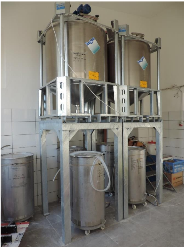
Wassertanks mit Rührwerk auf Gestell,