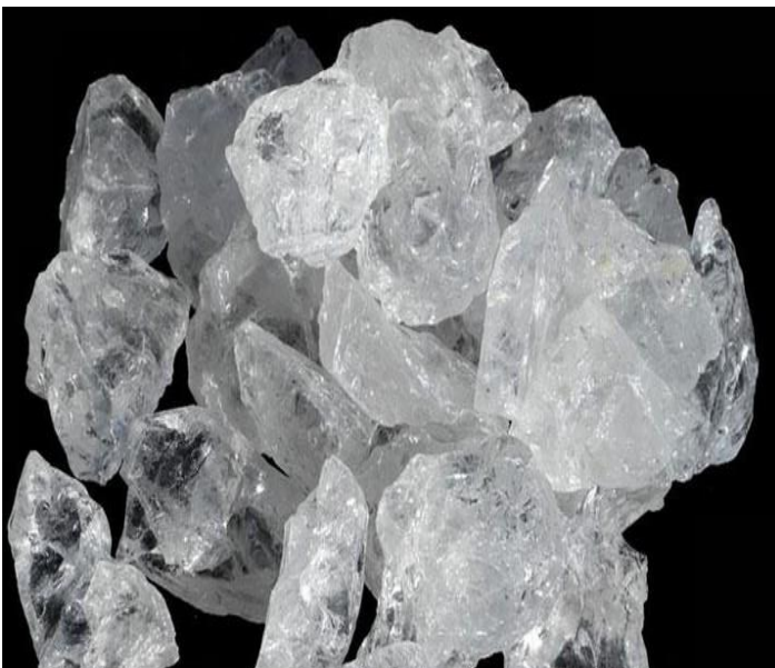
Brasilianischer Bergkristall / Quarz \text{SiO}_4 vor dem Mahlen auf unter 70 my.