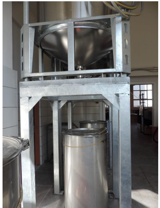
Absetztank unter Haupttank / Prototypen