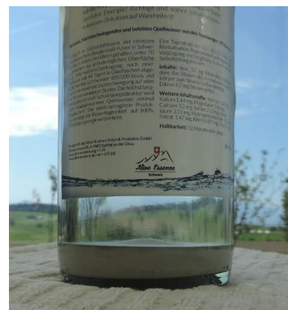
Bild: Kristallpulver am Boden abgesetzt.

Alle Gebäude werden mit neuesten Technologien für Elektromog-Absorbierung ausgestattet. Die verwendeten Kristalle sind dabei die besten Absorber sämtlicher negativer Strahlenbelastungen. Sie sorgen für einen Ausgleich des Erdmagnetfeldes, welches durch heutzutage unvermeidliche und störende elektromagnetische Strahlungen grundsätzlich in Mitleidenschaft gezogen wird und negative Einflüsse auf jedes Lebewesen – somit auch auf das Wasser - hat. Es wird jeglicher negativer Einfluss von außen auf die Wasserstrukturen vermieden und gleichzeitig sowohl das Energieniveau des hergestellten Wassers deutlich auf bis zu 1 Mio. Bovis erhöht als auch die Bioverfügbarkeit auf einen Level von 99- 100% transportiert, was einmalig ist unter allen in Europa verfügbaren Trink- und Tafelwässern. Diese Kristall-Schwingungen im ganzen Areal, sind auch in unsere Transportfahrzeuge vorhanden durch das Transportieren der Kristallwasser-Flaschen. Somit sind negative Strahlen beim Transport ferngehalten. Somit ist auch beim Kunden der Einsatz dieser Kristall-Technik zur Erhaltung der höchsten Bioverfügbarkeit anderer Produkte wie Nahrungsergänzungen durch unser Kristall-Wassers zu empfehlen. Zudem hat das Kristallwasser selber einen hohen Abschirmungs-Grad im Umkreis von 2 Metern gegen Elektromog. Getrunken und in den Körperzellen vollumfänglich verbreitet ist damit jeder Mensch intrazellulär gegen Elektromog geschützt.